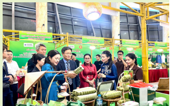
Sản phẩm đặc sản tiêu biểu Thái Nguyên, được đánh giá cao về chất lượng, mẫu mã và tiềm năng xây dựng thương hiệu trên thị trường

Nhân kỷ niệm 20 năm hợp tác giữa hai địa phương, ngành Công Thương tổ chức khu trưng bày sản phẩm và chương trình kết nối doanh nghiệp với trên 30 gian hàng, hàng nghìn sản phẩm của 2 tỉnh tại Nhà hát ca múa nhạc dân gian Việt Bắc tỉnh. Chương trình đã góp phần tạo cơ hội cho các đơn vị doanh nghiệp ký kết các Biên bản ghi nhớ hợp tác, mở ra cơ hội liên kết sản xuất, tiêu thụ và xúc tiến xuất khẩu, nâng tầm hàng hóa Thái Nguyên trong chuỗi giá trị toàn cầu.