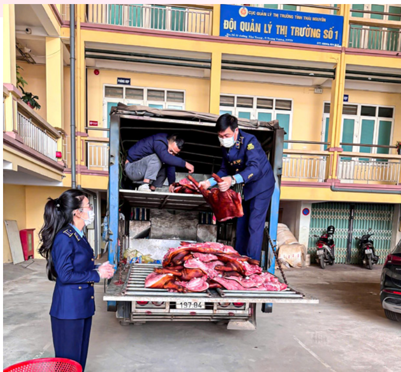
Tang vật vi phạm gồm 185 kg thịt lợn đã qua giết mổ, không có bao bì, nhãn mác, dấu kiểm soát giết mổ và giấy tờ chứng minh nguồn gốc, xuất xứ

Nhằm triển khai hiệu quả chỉ đạo của Ngành Công Thương về tăng cường kiểm tra, kiểm soát an toàn thực phẩm, rạng sáng ngày 08/01/2026, Đội Quản lý thị trường số 1, Chi cục Quản lý thị trường đã tiến hành kiểm tra một phương tiện vận tải dừng đỗ tại khu vực trước cổng Bệnh viện Phổi tỉnh Thái Nguyên.