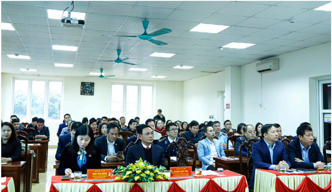
Các đại biểu tham dự Hội nghị