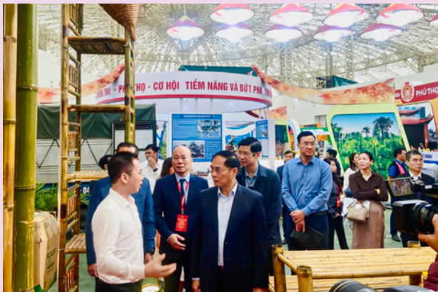
Phó Thủ tướng Chính phủ Bùi Thanh Sơn cùng lãnh đạo Cục Xúc tiến thương mại, (Bộ Công Thương) thăm, động viên cán bộ và doanh nghiệp tỉnh Thái Nguyên; ghi nhận tinh thần đổi mới, sáng tạo trong hoạt động xúc tiến và phát triển thị trường

Hội chợ Mùa Thu 2025, tổ chức tại Trung tâm Triển lãm Việt Nam, 62 doanh nghiệp, hợp tác xã của tỉnh tham gia trưng bày khoảng 5.000 sản phẩm đặc trưng. Không gian của tỉnh mỗi ngày thu hút trung bình 10.000 lượt khách tham quan, mua sắm; doanh số đạt khoảng 200 triệu đồng/ngày. Qua đó, Thái Nguyên được Ban Tổ chức vinh danh trong 30 đơn vị có “Không gian trưng bày tiêu biểu”, ghi nhận sự đầu tư chuyên nghiệp và hiệu quả xúc tiến thực chất, đồng thời khẳng định bước tiến vững chắc trong xây dựng hình ảnh không gian xúc tiến hiện đại, bản sắc và có sức cạnh tranh ngay tại trung tâm giao thương lớn nhất cả nước.