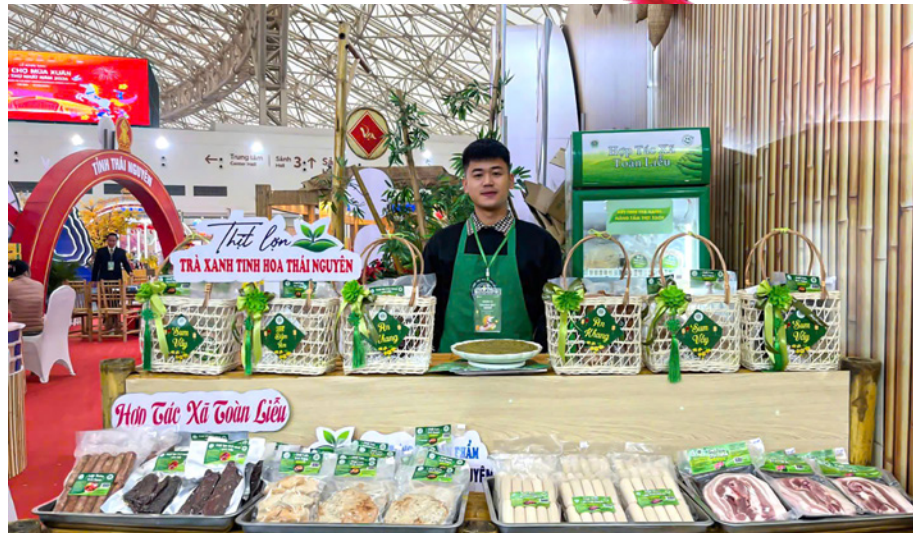
Thịt lợn trà xanh của HTX Toàn Liễu trưng bày tại Hội chợ Mùa Xuân lần thứ Nhất năm 2026, được người tiêu dùng lựa chọn cho giỏ hàng Tết