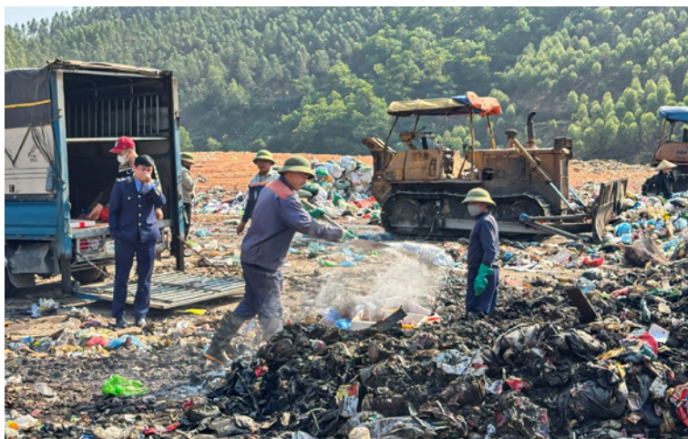
Lực lượng chức năng tổ chức giám sát tiêu hủy toàn bộ số thịt lợn vi phạm theo đúng quy định của pháp luật, bảo đảm an toàn vệ sinh môi trường

Căn cứ quy định pháp luật, Đội trưởng Đội Quản lý thị trường số 1