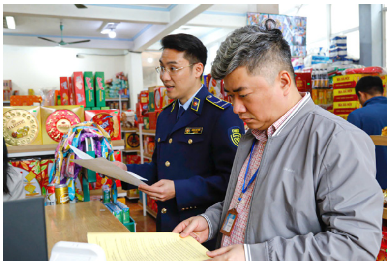
Đoàn kiểm tra liên ngành số 2 trao đổi, hướng dẫn cơ sở thực hiện các quy định pháp luật về ATTP dịp Tết Nguyên đán tại xã Phú Lương

an toàn thực phẩm (ATTP) tại cơ sở; kiểm soát chặt chẽ các nhóm sản phẩm tiêu thụ nhiều trong dịp Tết và Lễ hội; kịp thời phát hiện, ngăn chặn, xử lý nghiêm các vi phạm, không để