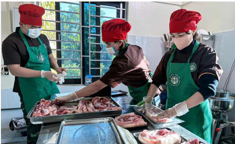
Sản phẩm thịt lợn trà xanh Thái Nguyên sẽ được trưng bày, giới thiệu tại các chương trình xúc tiến thương mại 2026