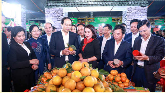
Đồng chí Trịnh Xuân Trường, Bí thư Tỉnh ủy cùng các đại biểu trao đổi và tìm hiểu các sản phẩm đặc sản của các tỉnh tham gia Festival

Festival tạo không gian quảng bá, kết nối tiêu thụ nông sản và sản phẩm OCOP; gắn thương mại với du lịch và trải nghiệm văn hóa. Sự kiện góp phần nâng cao giá trị thương hiệu vùng miền và thúc đẩy phát triển kinh tế bền vững.