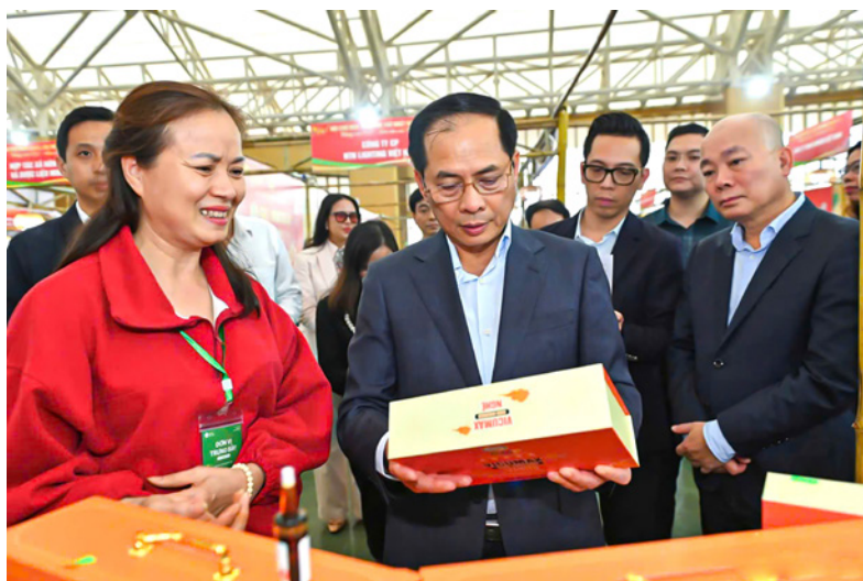
Phó Thủ tướng Chính phủ Bùi Thanh Sơn, Trưởng Ban Chỉ đạo các Hội chợ Quốc gia cùng lãnh đạo các bộ, ngành tham quan không gian triển lãm tỉnh Thái Nguyên, ghi nhận chất lượng các sản phẩm OCOP 5 sao cấp quốc gia và định hướng mở rộng thị trường tiêu thụ.

Hội chợ diễn ra đến ngày 13/02, mở cửa miễn phí từ 9h00 đến 22h00 hằng ngày, dự kiến thu hút hàng triệu lượt người dân và du khách tham quan, mua sắm dịp Tết Nguyên đán./.