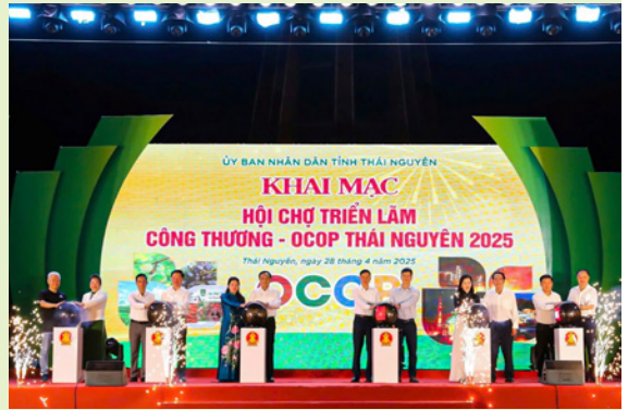
Các đại biểu thực hiện nghi thức Khai mạc

Với 200 gian hàng của 30 tỉnh, thành phố, thu hút khoảng 60.000 lượt khách tham quan, Hội chợ trở thành sự kiện xúc tiến trọng điểm của tỉnh. Không chỉ quảng bá sản phẩm OCOP và công nghiệp nông thôn tiêu biểu, sự kiện còn thúc đẩy liên kết sản xuất, phân phối, tiêu thụ và mở rộng mạng lưới thị trường và nâng cao sức cạnh tranh sản phẩm địa phương.