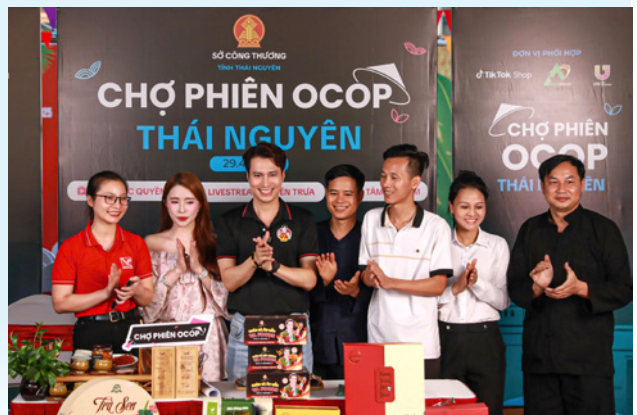
Phiên livestream trên nền tảng Tiktok, góp phần tăng doanh thu cho doanh nghiệp

Các chương trình đạt 70 triệu lượt tiếp cận, 1,3 triệu lượt xem trực tiếp, hơn 2.500 đơn hàng; các phiên tiếp theo thu hút hơn 10 triệu lượt tiếp cận, gần 300.000 lượt xem và gần 1.500 đơn hàng. Đây là bước chuyển mạnh mẽ trong ứng dụng thương mại điện tử, mở rộng thị trường tiêu thụ trên nền tảng số.