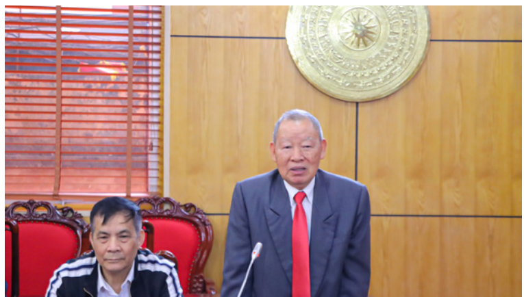
Đại diện các đồng chí Nguyên lãnh đạo ngành Công Thương phát biểu tại Chương trình