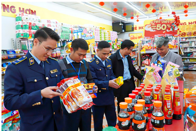
Đoàn kiểm tra liên ngành số 2 kiểm tra thực tế điều kiện bảo đảm an toàn thực phẩm tại cơ sở sản xuất, kinh doanh trên địa bàn xã Định Hóa