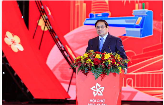
Thủ tướng Chính phủ Phạm Minh Chính phát biểu tại Lễ Khai mạc Hội chợ

Sáng 02/02/2026, Hội chợ Mùa Xuân lần thứ nhất năm 2026 với chủ đề “Kết nối thịnh vượng - Đón xuân huy hoàng” khai mạc tại Trung tâm Triển lãm Việt Nam. Thủ tướng Chính phủ Phạm Minh Chính tham dự và phát biểu chỉ đạo.