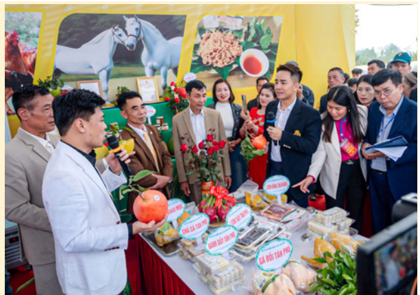
Các diễn viên nổi tiếng tham gia giao lưu, quảng bá sản phẩm Gà đồi Tân Khánh và nông sản Thái Nguyên tại xã Tân Khánh

Chương trình hỗ trợ liên kết sản xuất, chế biến, tiêu thụ; đẩy mạnh truyền thông và đưa sản phẩm vào hệ thống phân phối hiện đại. Gà đồi Tân Khánh từng bước được định vị là sản phẩm chăn nuôi đặc trưng của tỉnh.