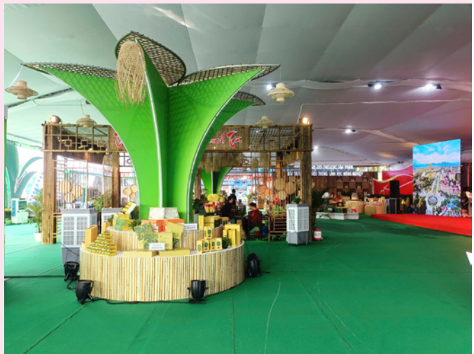
Không gian triển lãm văn hóa trà của tỉnh Thái Nguyên tại Lễ kỷ niệm 80 năm Quốc khánh 2/9/2025