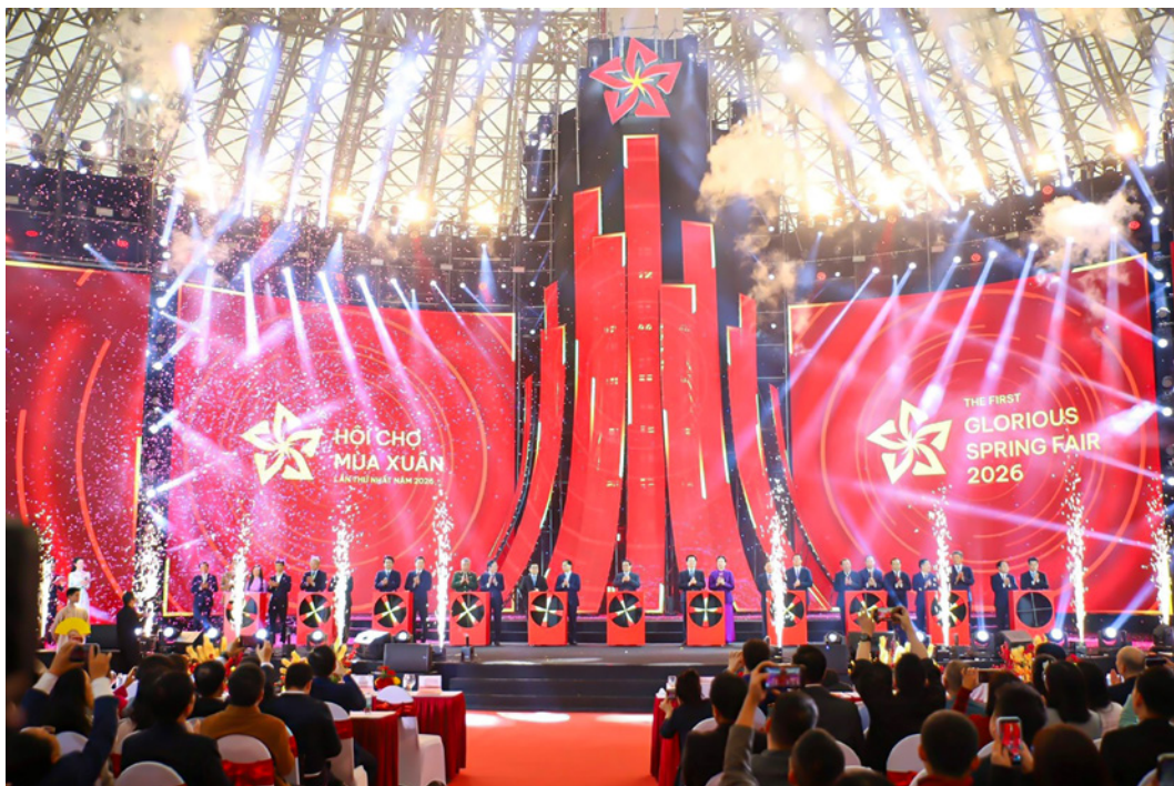
Các đại biểu thực hiện nghi thức khai mạc Hội chợ

hội nhập. Thủ tướng nhấn mạnh Hội chợ 2026 tạo xung lực mới kích cầu thị trường trong nước ngay từ đầu năm, đồng thời yêu cầu các địa phương nâng cao chất lượng, minh bạch nguồn gốc sản phẩm và đẩy mạnh chuyển đổi số trong xúc tiến thương mại.