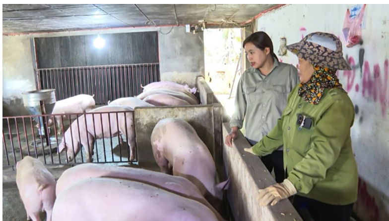
Đẩy mạnh công tác thông tin, tuyên truyền quảng bá, giới thiệu sản phẩm "Thịt lợn trà xanh - Tinh hoa Thái Nguyên"

Trong năm 2025, Sở Công Thương đã lồng ghép hoạt động quảng bá, giới thiệu và kết nối tiêu thụ sản phẩm trong các chương trình xúc tiến thương mại, hội chợ, triển lãm trong và ngoài tỉnh do Trung tâm Khuyến công và Xúc tiến Thương mại tỉnh tham gia và tổ chức. Đồng thời, Sở hỗ trợ doanh nghiệp, hợp tác xã trưng bày, giới thiệu sản phẩm, chuẩn bị tham gia Festival Nông sản, OCOP, làng nghề gắn với du lịch Thái Nguyên 2025, qua đó từng bước xây dựng hình ảnh và nâng cao nhận diện sản phẩm đặc trưng của tỉnh trên thị trường.