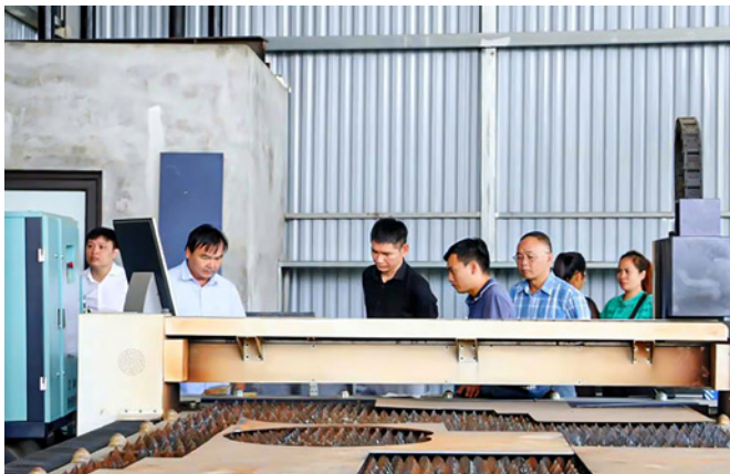
Hoạt động khuyến công góp phần đẩy mạnh phát triển công nghiệp nông thôn trên địa bàn tỉnh Thái Nguyên

T heo đó, Chương trình tập trung hỗ trợ xây dựng mô hình trình diễn kỹ thuật; chuyển giao công nghệ, ứng dụng máy móc tiên tiến vào sản xuất công nghiệp - tiểu thủ công nghiệp; thúc đẩy sản xuất sạch hơn, sản xuất và tiêu dùng bền vững, với mục tiêu triển khai 100 đề án, hỗ trợ khoảng 200 doanh nghiệp, cơ sở công nghiệp nông thôn.