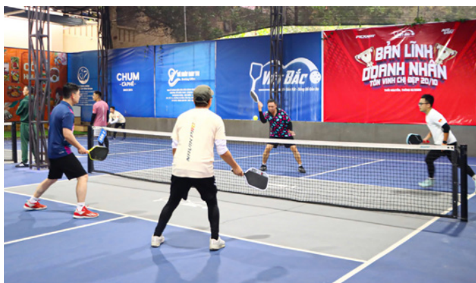
Các vận động viên tham gia thi đấu ở 3 nội dung đôi nam Lãnh đạo, đôi nam phong trào và đôi nữ

D ự Chương trình có các đồng chí Ban Thường Vụ, Ban lãnh đạo Sở Công Thương, lãnh đạo các phòng, đơn vị trực thuộc, các cố động viên và vận động viên là cán bộ, công chức, viên chức, người lao động (CBCCVCNLĐ) ngành Công Thương Thái Nguyên. Các vận động viên thi đấu 03 nội dung: Đôi nam lãnh đạo, đôi nam phong trào, và đôi nữ. Kết thúc giải đấu, Ban Tổ chức trao giải (Vô địch, Nhì, Ba) cho các đôi xuất sắc ở từng nội dung cùng những phần quà của các Nhà tài trợ.