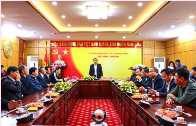
Toàn cảnh Chương trình