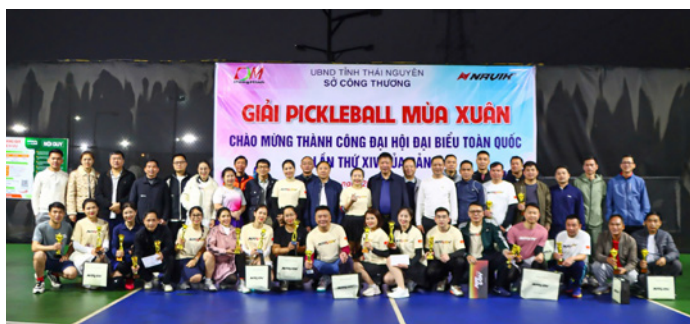
Ban Giám đốc Sở Công Thương chụp hình lưu niệm cùng các vận động viên tham gia giải Pickleball mùa Xuân năm 2026

Thông qua giải đấu, không khí vui tươi, phấn khởi được lan tỏa, góp phần tăng cường gắn kết giữa lãnh đạo với cán bộ, công chức, viên chức, người lao động; xây dựng sân chơi thể thao lành mạnh, nâng cao tinh thần rèn luyện thể dục thể thao và đoàn kết nội bộ. Qua đó thúc đẩy phong trào thể dục thể thao, tạo khí thế thi đua sôi nổi hoàn thành nhiệm vụ năm 2026./.