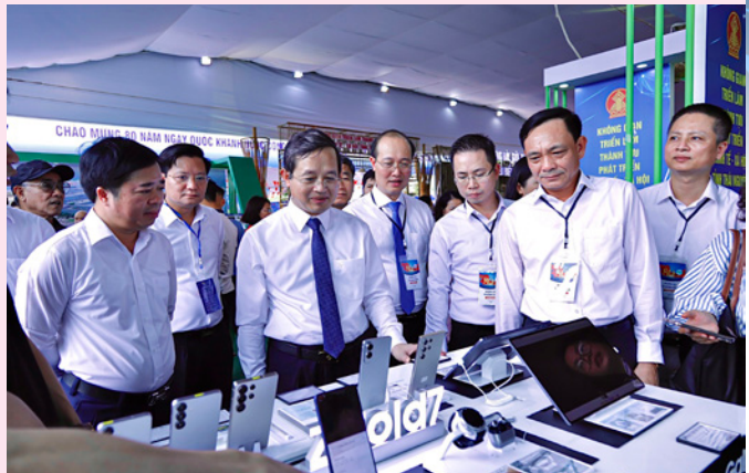
Các đồng chí Lãnh đạo tỉnh Thái Nguyên thăm quan không gian triển lãm đổi mới sáng tạo của tỉnh Thái Nguyên tại Lễ Kỷ niệm 80 năm Quốc khánh 2/9

Những con số ấn tượng ấy là minh chứng rõ nét về xúc tiến thương mại, tiếp tục khẳng định sức hút, giá trị thương hiệu và năng lực cạnh tranh, từng bước nâng tầm hình ảnh Thái Nguyên, khẳng định vị thế và tiềm năng phát triển bền vững của tỉnh trong tiến trình hội nhập và phát triển.